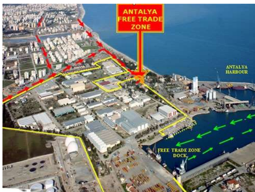
شکل ۲- نقشه موقعیت منطقه آزاد آنتالیا