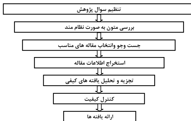
شکل شماره (۱): مراحل روش فراترکیب

فرا ترکیب نوعی مطالعه کیفی می‌باشد که اطلاعات و یافته‌های استخراج شده از مطالعات کیفی دیگر با موضوع مرتبط و مشابه را بررسی می‌کند. (زیمیر ۲۰۰۴). در این تحقیق از مراحل هفتگانه سندلوسکی و باروسو (۲۰۰۳ و ۲۰۰۷) که در شکل شماره (۱) نشان داده شده است جهت دستیابی به اهداف تحقیق استفاده شده است.