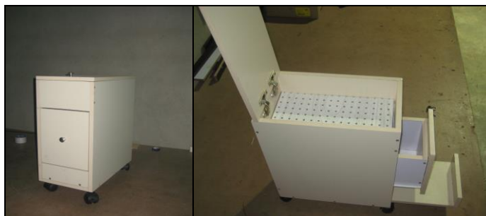
شکل ۱- نمای بسته و باز پایلوت طراحی شده