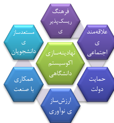
شکل ۱- مدل پنج بُعدی نهادینه‌سازی زیست بوم کسب‌وکار دانشگاهی

«سیستم» ۱ تشکیل شده است که منشاء اکو به محیط زیست و ارتباط میان اجزایی یک اجتماع بر می‌گردد و از طریق سیستمی یکپارچه مثل صنعت یا دانشگاه تلاش دارد تا براساس راهبردهای منسجم به اثربخشی بیشتر در حوزه‌های مختلف همچون اقتصاد کمک نماید. مور (۱۷)؛ یانسیتی و لوین (۱۸) و تیس (۱۹) زیست بوم کسب‌وکار کارآفرینی در مطالعات مدیریتی را مبتنی بر تسلسل شبکه‌ای ایده‌ها و نوآوری‌هایی تعریف می‌کند که در قالب یک پلتفرم قادر به ایجاد ارزش‌های پایدار در اجتماع و بازار خواهد بود. مانیمالا و واسدانی (۲۰) زیست بوم کسب‌وکار کارآفرینی دانشگاه را فرآیندی از به‌کارگیری و سفارشی‌سازی تعریف می‌نمایند که فعالیت‌های آن طیف وسیعی از عملکردهای تخصصی؛ بازار؛ صنعت؛ منطقه و حتی جهان را تحت تأثیر قرار می‌دهد و به ایجاد مشاغل پایدارتر در یک اقتصاد پویا کمک می‌نماید. لیندا و همکاران (۲۱) در قالب یک مدل ۵ بُعدی نهادینه‌سازی زیست بوم کسب‌وکار دانشگاهی را شامل: