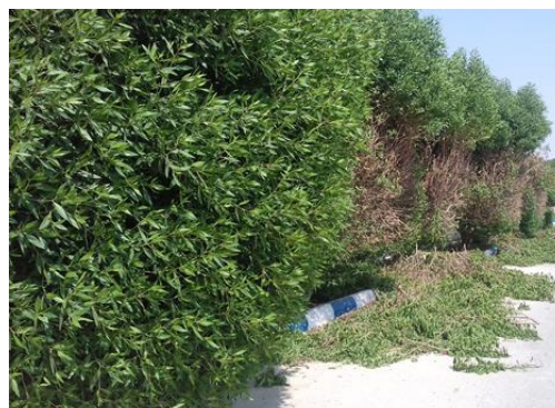
شکل ۱- هرس درختان کنوکارپوس در شهر بهبهان

برای جداسازی الیاف شاخه و برگ کنوکارپوس از روش فرانکلین (۱۱) استفاده شد. اندازه‌گیری طول و قطر الیاف، قطر حفره و ضخامت دیواره سلولی ۱۰۰ عدد الیاف، از هر اسلاید ۱۰ عدد الیاف (۱۲)، با استفاده از میکروسکوپ دو چشمی