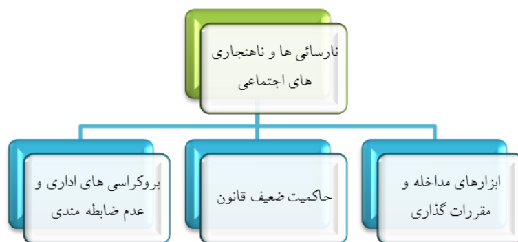
شکل ۳- مقررات گذاری ناقص و نارسایی ها

می رسد روح همکاری و تعامل در ساختارهای تصمیم ساز و تصمیم گیر تا حد زیادی تنزل یافته و چشم گیر نبوده است. در اثر بروکراسی های اداری و عدم ضابطه مندی، مقررات گذاری با مشکل روبرو شده است. هر چند گاه این مشکل برآمده از ناهنجاری و ناهمگونی های ساختاری است. همین امر سبب گردیده تا بحران هایی از جمله بحران محیط زیستی در جامعه نمود پیدا کند.