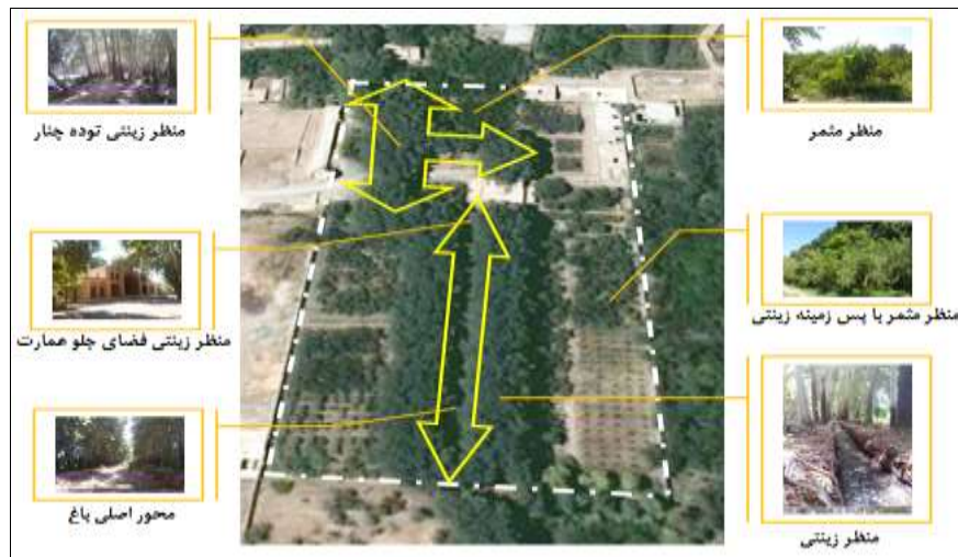
شکل ۳- تحلیل تصویر هوایی باغ پهلوانپور بر مبنای منظر زینتی (خطوط زردرنگ) و منظر مثمر (سایر فضاهای باز)؛ منبع:

باغ شاهزاده ماهان از جمله باغ‌تخت‌های ایرانی متعلق به دوره قاجار است که باغ‌آرایی مطبق آن در بستری شیب‌دار موجب غنای رابطه ناظر و منظر شده است. کوشک اصلی در بالاترین تخت و