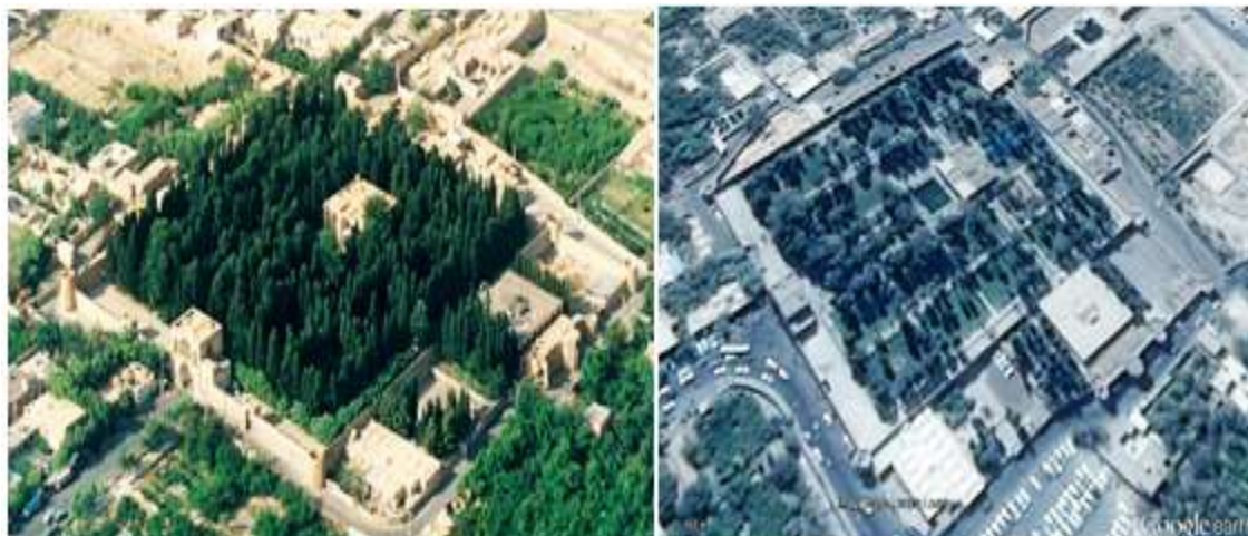
شکل ۴- مقایسه وضعیت فعلی حجم گیاهی باغ فین (عکس راست) نسبت به دهه هفتاد خورشیدی (عکس چپ)؛