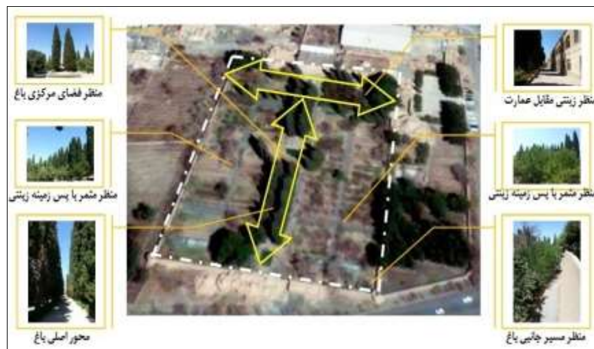
شکل ۲- تحلیل تصویر هوایی باغ رحیم‌آباد بر اساس منظر زینتی (فلش‌های زردرنگ) و منظر مثمر (سایر فضاهای باز); منبع: