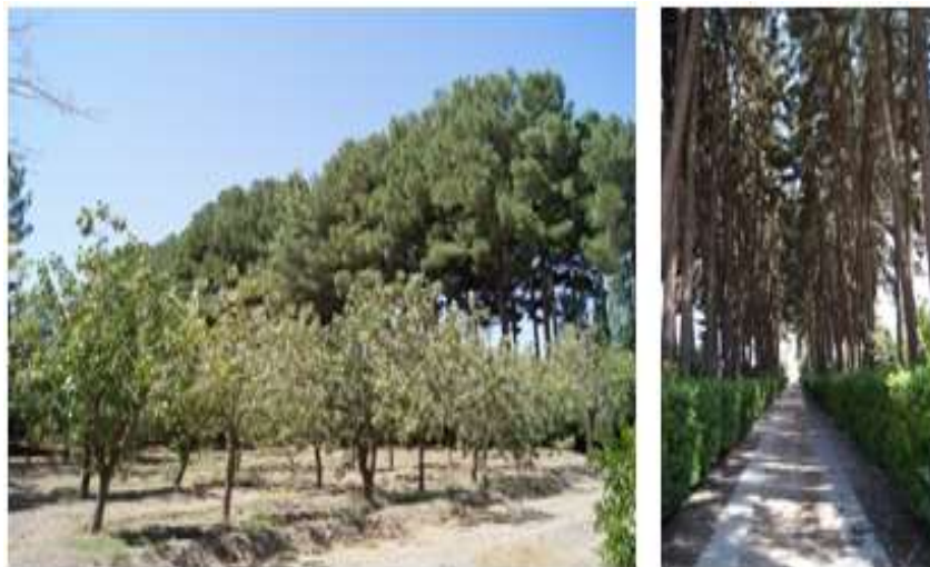
شکل ۱- ادراک دو نوع منظر زینتی (راست) و مثمر (چپ) در باغ اکبرییه