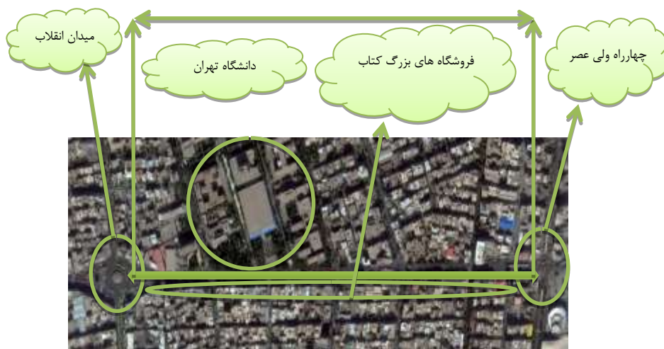
شکل ۲- عکس هوایی حدفاصل میدان انقلاب اسلامی تا چهارراه ولی عصر (۱۴)

Figure 1. Distance between Enqelab square and Vali asr intersection reference:(14)