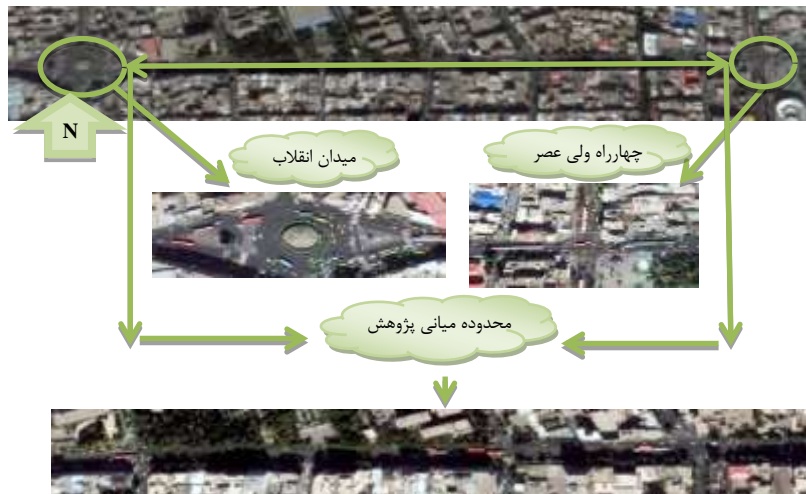
شکل ۱- حدفاصل میدان انقلاب اسلامی تا چهارراه ولی عصر (۱۴)

گاه های بزرگ کتاب و نشریات و چاپ خانه ها در آن اشاره کرد (شکل ۲). این خیابان به همراه نقاط ابتدا و انتهای پژوهش که به ترتیب میدان انقلاب و چهارراه ولی عصر بوده جزو منطقه شش تهران محسوب می شود. لازم به ذکر است که این منطقه در مجاورت منطقه یازده قرار دارد. نسبت قرارگیری این