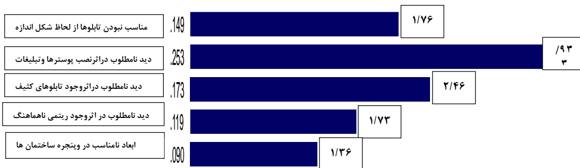
نمودار ۲- درجه اهمیت مولفه های شاخص نما و تبلیغات منبع: (نگارندگان: ۱۳۹۴)