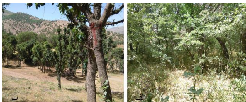
شکل ۲- نمایی از جنگل مورد مطالعه. الف: توده کمتر دست‌خورده؛ ب: توده گلازنی‌شده

در این تحقیق، توده کم‌تردست‌خورده و گلازنی‌شده دارای مساحت به ترتیب ۱/۷ و ۰/۶ هکتار بودند. متوسط شیب دو توده ۲۰ درصد و جهت عمومی شمالی بود. وضعیت آب و هوایی منطقه اغلب متأثر از جبهه‌های هوای مدیترانه‌ای است. میانگین