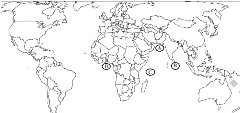
شکل ۱- نمایش جغرافیایی محل صید ماهیان تون مورد نمونه‌برداری از چهار صیدگاه تأمین مواد اولیه کنسرو تون