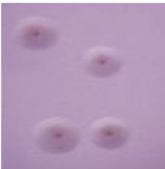
نگاره ۱- تصویر میکروسکوپی پرگنه‌های مشاهده شده بر روی محیط PPLO Agar

در آزمایش PCR نیز که بصورت تکرار برای هر نمونه‌ی کشت شده انجام شد نتایج یکسان بود بدین‌صورت که هم از نمونه‌های غنی‌شده و هم از پرگنه‌های خالص ایجاد شده‌ی هر نمونه در محیط جامد، استفاده گردید و نتیجه‌ی حرکت محصول PCR پس از استفاده از آغازگر شناسایی جنس تشکیل باند ۱۶۳ bp در هر ۸ نمونه بود (نگاره ۲). جهت شناسایی گونه‌ی باکتری در آزمایش PCR از آغازگر شناسایی گونه استفاده گردید و نتیجه‌ی حرکت محصول PCR بر روی ژل آگارز تشکیل باند ۳۷۵ bp در یک نمونه از ۸ نمونه‌ای بود که در آزمایشات PCR قبلی جنس مایکوپلازما آنها تأیید شده بود (نگاره ۳).