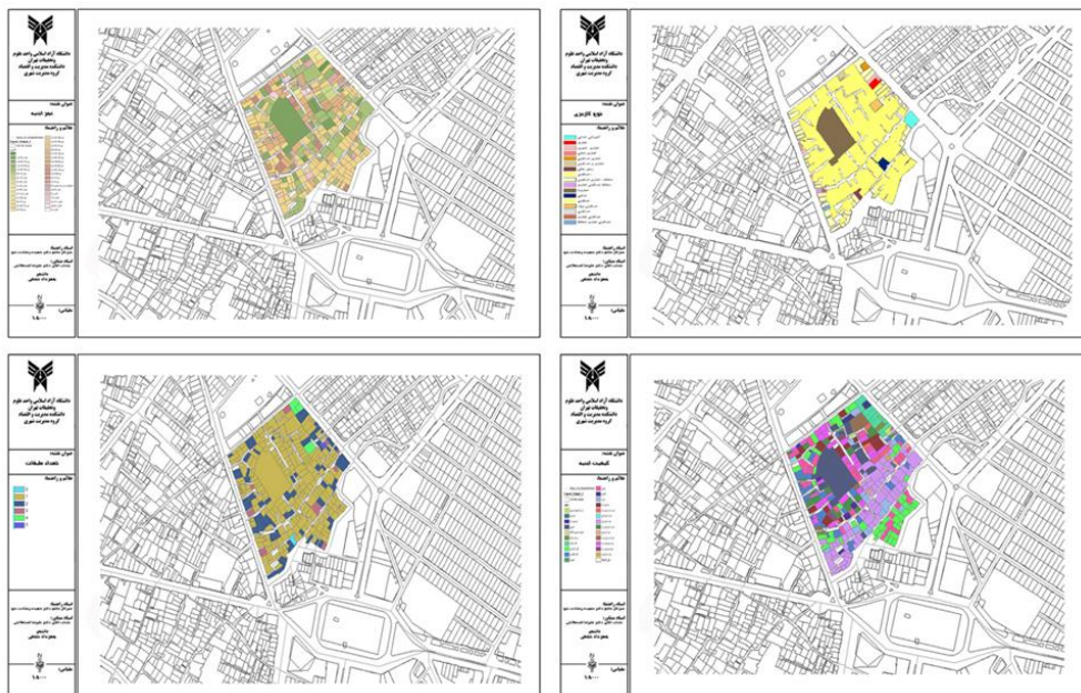
شکل ۲: نقشه محدوده مورد مطالعه و نقشه‌های نوع کاربری، عمرانیه، کیفیت ابنیه، تعداد طبقات