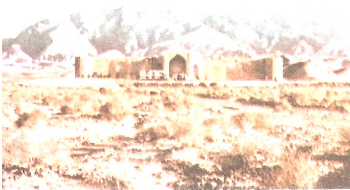
نمای شمالی کاروانسرای شاه عباسی که سرشکاربانی پارک ملی کویر در آن

این ساختمان برعکس نامش کاروانسرا نبوده و به طوری که مطلعیم می‌گویند ساختمان شکاری سلاطین صفوی بوده است. وجود شاه نشین در ضلع غربی و آبراه سنگی برای انتقال آب از چشمه شاهی سیاه کوه به این قصر و نیز دو کاروانسرای دیگر که به عنوان حرمخانه و احتمالاً قوشخانه و محل اقامت رعایا مورد استفاده قرار می‌گرفته گواه بر این مدعی است که این ساختمان مخصوص مسافرت‌های شکار پادشاهان صفوی بوده است. ساختمان مذکور هم اکنون به عنوان میهمانسرا پاسگاه شکاربانی در پارک ملی کویر مورد بهره‌برداری قرار می‌گیرد.