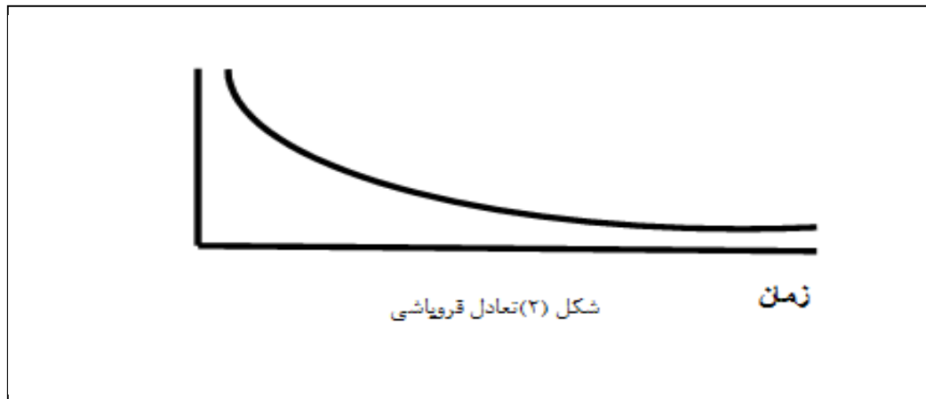
شکل ۲: تعادل فروپاشی، چورلی، ترجمه معتمد، ۱۳۷۵، ص ۳۰

ناپذیر دارد به طوری که این مفهوم ریشه در تکامل آلی، بیشینه‌سازی آنتروپی و پس‌خورند مثبت دارد. با توجه به مدل دیویس، حالتی که شدت تغییر شکل، در طول زمان به کندی کاهش می‌یابد (فرو می‌پاشد). در چرخه‌ی فرسایش دیویس، آخرین سطحی که ناهمواری کم دارد (دشت‌گون) تقریباً شکل تعادلی دارد (شکل ۲) (چورلی، ترجمه، ۱۳۷۵، ص ۸۹-۴۴-۲۹).