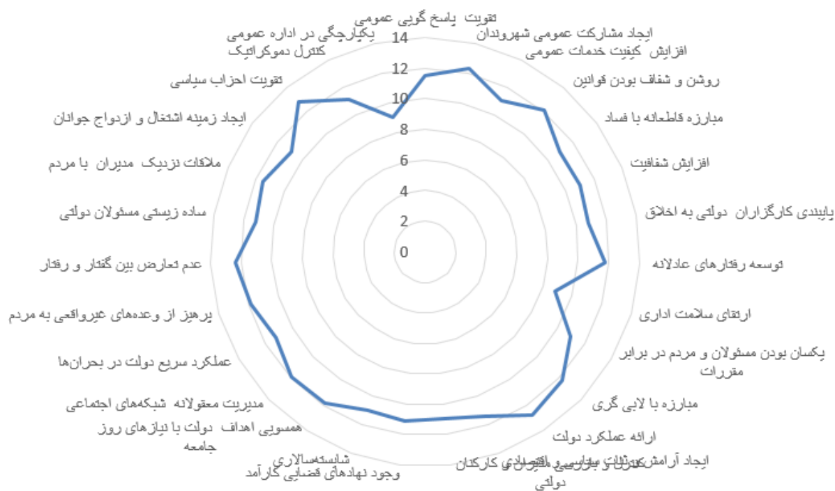
شکل ۳. نتایج مرحله اول نظرسنجی خبرگان