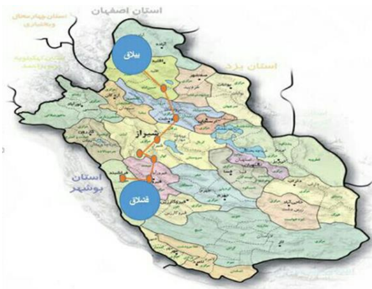
شکل (۱): موقعیت نسبی قلمرو ایل قشقایی - تیره هیبت لو

در قلمروها، از دیرباز مورد توجه گردشگران و علاقمندان به حفظ طبیعت بوده است. شکل شماره ۱ موقعیت جغرافیایی منطقه‌ی مورد مطالعه را نشان می‌دهد.