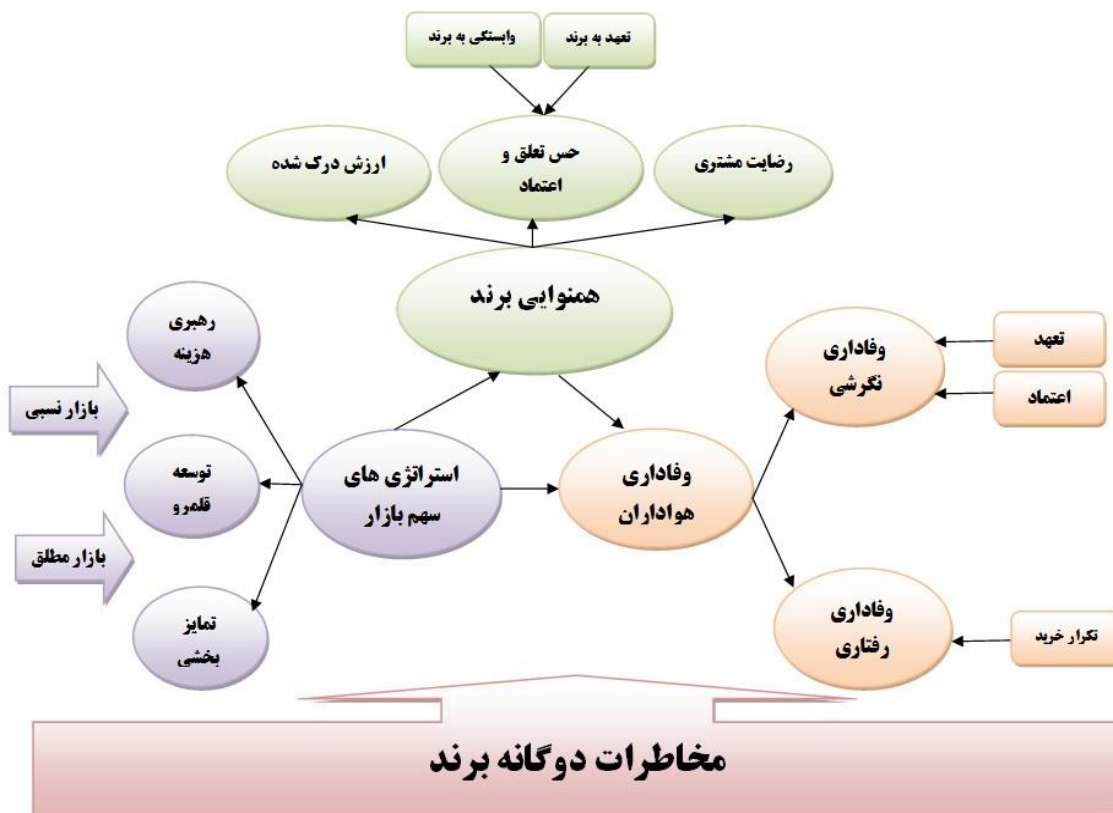
شکل (۲): مدل پیشنهادی تحقیق

باشگاه به جذب هواداران ثابت منجر به جریان پیدا کردن سود و درآمد آوری می شود. وفاداری یک فرآیند مهم می باشد و به شکل دهی تیم کمک شایانی می کند. تداعی برند بر تصویر و نگرش فرد تأثیر گذار است و می تواند به صورت منفی و یا مثبت باشد. که البته در تحقیق فوق این تصویر به صورت مثبت می باشد. دویلی و فانک (۲۰۱۳) پژوهش خود را در مورد سهم بازار گروهی کوچک و بزرگ با وفاداری نگرشی در دو تیم فوتبال و راگی مورد بررسی قرار دادند. در این تحقیق وفاداری و همنوایی بیشتر به سمت سهم بازار گروهی بزرگتر و قوی تر نشان داده شده است. مخاطرات دوگانه به عنوان بنیایی جهت توسعه دانش وابسته به همنوایی برند معرفی گردیده است. البته به دنبال آن ارائه تولید مشتری و خدمات مصرفی برای رسیدن به انگیزه های جدید تر در سازمان پیشنهاد شده است. مخاطرات دوگانه براساس ارزش، عملکرد، رویکرد، اهداف، خدمات، فرصت ها و تهدیدات و یا حتی نقاط ضعف و قوت تیم می باشد. هواداران سهم بازار گروهی در تلاش اند تا در جهت اتخاذ تصمیم و درک