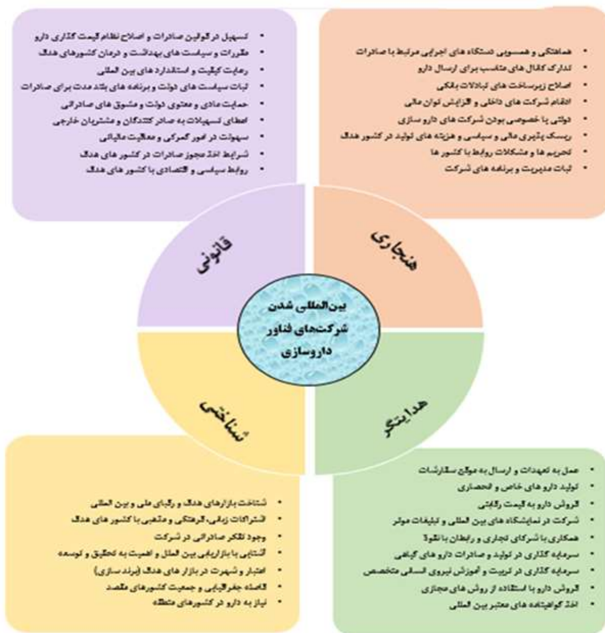
نمودار ۱ - عوامل نهادی تاثیرگذار در بین‌المللی سازی شرکت‌های فناور داروسازی