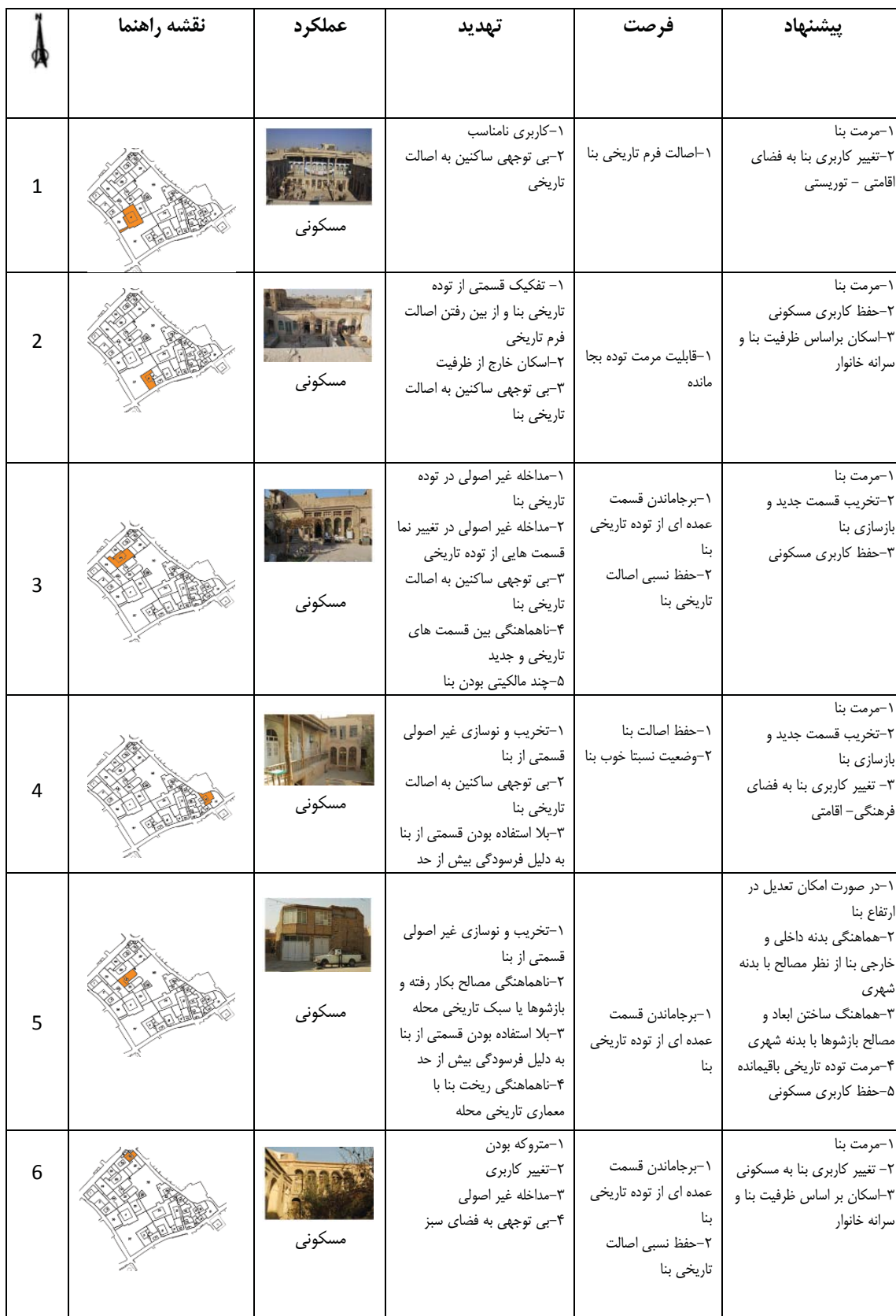
جدول ۹. تحلیل نقاط ضعف و قوت بنا