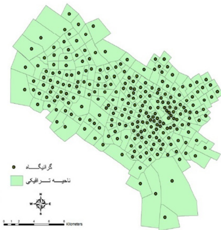
شکل ۱. نقشه نواحی ترافیکی شهر مشهد

d_i : فاصله مرکز ناحیه i تا نزدیک ترین خط استخوان بندی حمل و نقل همگانی مقادیر متغیرهای P_i ، W_j ، VK_j و K_j از بانک اطلاعات مطالعات جامع حمل و نقل مشهد در افق زمانی ۱۴۱۰ استخراج گردیده است. همچنین متغیر d_i به کمک امکانات نرم افزار GIS در حالت گزینه های ۱ و ۲ استخوان بندی حمل و نقل همگانی به طور جداگانه محاسبه شده است. با توجه به اینکه متغیرهای فوق الذکر به تفکیک ۲۵۳ ناحیه استخراج شده اند، ارائه مقادیر آنها به دلیل محدودیت حجم مقاله امکان پذیر نمی باشد.