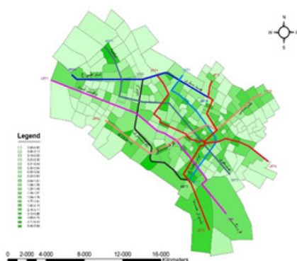
شکل ۵. حدود تغییرات مقادیر شاخص دسترسی به تفکیک ۲۵۳ ناحیه ترافیکی در حالت گزینه ۲