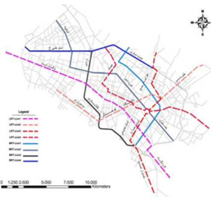
شکل ۳. نمایش مسیر خطوط استخوان‌بندی حمل‌ونقل همگانی در حالت گزینه ۲ (عدم تحقق تعریض‌ها)

در این تحقیق جهت تجزیه و تحلیل‌های آماری و آزمون فرضیات تحقیق از نرم‌افزار SPSS ۱۴ استفاده شده است. نرم‌افزار SPSS برای تجزیه و تحلیل آماری و مدیریت داده‌ها استفاده می‌شود. اگرچه این نرم‌افزار در ابتدا برای تحلیل داده‌ها در حوزه علوم انسانی ابداع شد لکن در حال حاضر با توجه به مزایای فراوانی که دارد، در تمام شاخه‌های علوم مورد استفاده قرار می‌گیرد (اسماعیلی و خیری، ۱۳۸۵، ۲). برای مقایسه شاخص دسترسی در حالت گزینه‌های ۱ و ۲ استخوان‌بندی حمل‌ونقل همگانی از آزمون میانگین استفاده شده است. فرض تحقیق این است که میانگین شاخص دسترسی در حالت گزینه ۲ به‌طور معناداری بیشتر از حالت گزینه ۱ است و فرض صفر این است که میانگین‌های مذکور باهم اختلاف معناداری ندارند. معمولاً وقتی که واژه «نتیجه معنادار» استفاده می‌شود منظور رد فرضیه صفر در سطح خطای