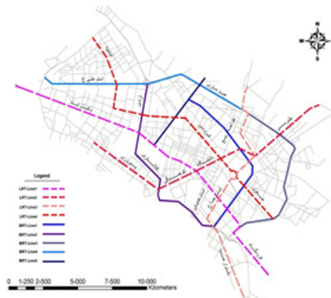
شکل ۲. نمایش مسیر خطوط استخوان‌بندی حمل‌ونقل همگانی در حالت گزینه ۱ (عدم تحقق تعریض‌ها) ۱۳