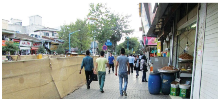
شکل ۲. تراکم جمعیت و محصولیت خیابان علم الهدی در بخش مرکزی شهر رشت در سال ۱۳۹۱