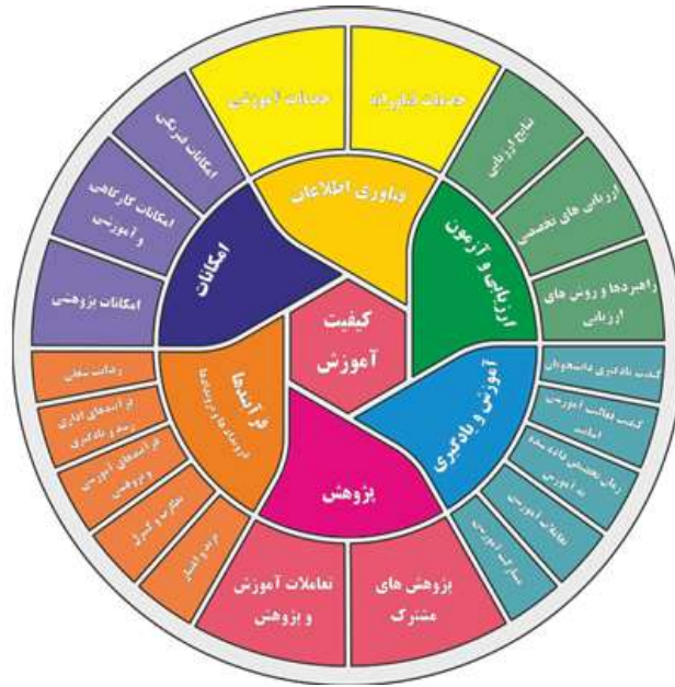
شکل ۱. مدل جامع پژوهش