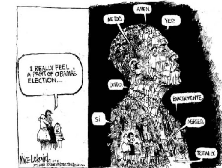
Lincoln Memorial ۶

دربارگی از کاریکاتورها مردم مستقیماً از باراک اوپاما حمایت می‌کنند. در یک کاریکاتور نشان داده می‌شود که مردم به امید دریافت مالیات بیشتر از طبقه مرفه جامعه به او رای می‌دهند. در بیشتر کاریکاتورها گروه‌های سنی مختلف حمایت خود را نشان می‌دهند.