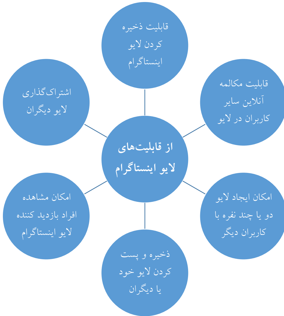
شکل ۲- قابلیت‌های لایو اینستاگرام