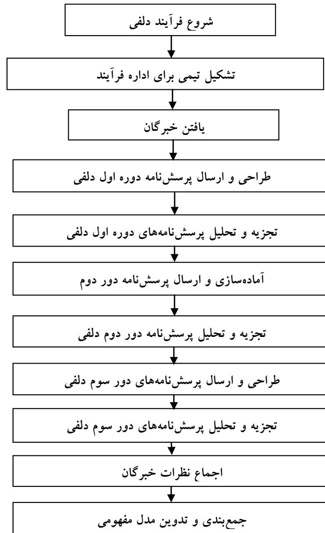
شکل (۱): فرایند اجرای دلفی

۲) مولفه روان‌شناختی، در بعد فردی به عنوان یک مولفه تاثیرگذار بر توانمندسازی کارکنان شناخته شد، این مولفه دارای شاخص‌های مسئولیت‌پذیری، هوش، تناسب شخصیت شاغل با شغل (شخصیت شغلی)، ریسک‌پذیری است.