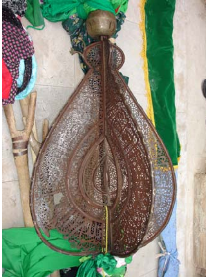
۲- بخش اصلی توغ (ماه‌یچه)