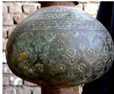
۴- صندوقچه مدور