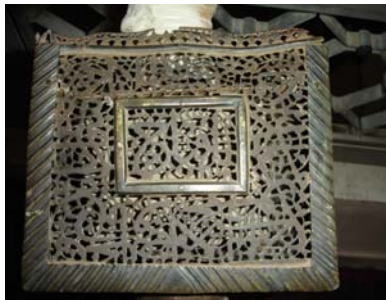
۵- صندوقچه مکعب