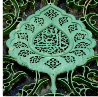
نگاره ۲۵ (زیارتگاه شاهزاده اسماعیل، اواخر سده ۱۱)