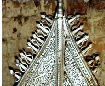
نگاره ۲۷ (توغ حسینیّه، ابوزیدآباد، سده ۱۲)