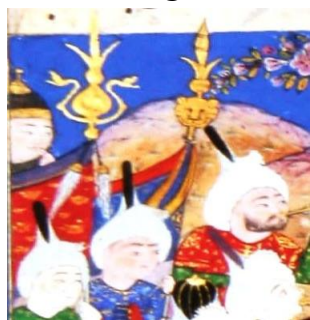
نگاره ۶ (شاهنامه طهماسبی، سال ۱۹۲۸ هـ)