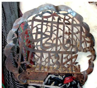
نگاره ۲۰ (سرتیغ توغ، ابوزیدآباد، اوایل سده ۱۲) (سرتیغ توغ حسینی، نوش‌آباد، ۱۱۲۱ هـ)