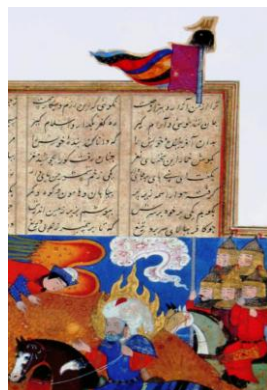
نگاره ۳ (خاورنامه، سال ۱۸۱۲ هـ)