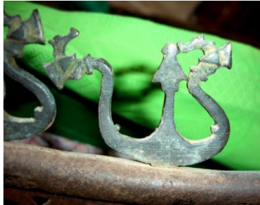
نگاره ۲۸ (توغ دربرینگ، آران و بیدگل، ۱۱۱ هـ)