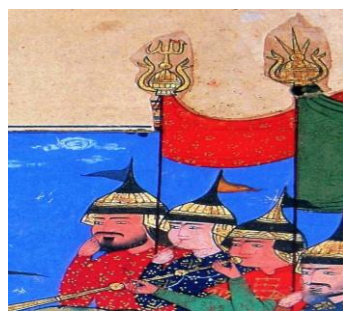
نگاره ۵ (ظفرنامه، سال ۱۹۳۵ هـ)