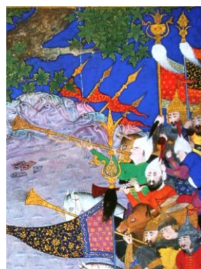
نگاره ۷ (شاهنامه طهماسبی، سال ۹۲۸ هـ)