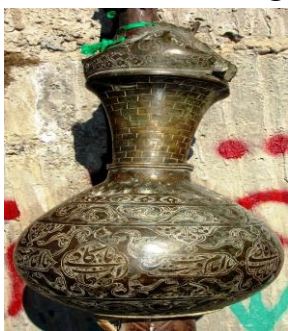
نگاره ۱۶ (صندوق مدور توغ حسینیه، نوش آباد، سال ۱۱۲۳هـ)

(توغ مسجد دربربگ، آران و بیدگل، سال ۱۱۱۰هـ)