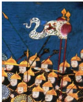
نگاره ۲ (کاخ گلستان، ۱۸۳۳ هـ)