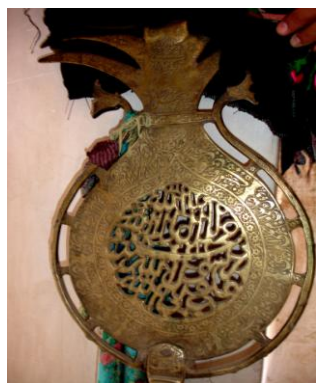
نگاره ۸ (توغ برنجی، آران و بیدگل، سال ۱۰۴۶ هـ)