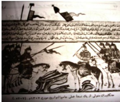
نگاره ۱ (توغ در مینیاتور، سال ۱۷۰۷ هـ)