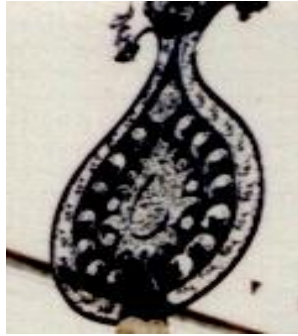
نگاره ۲۶ (توغ عالی قاپو، اردبیل، سده ۱۲)