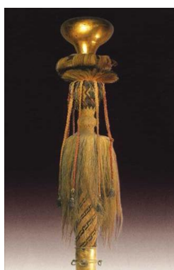
نگاره ۴ (توغ عثمانی)