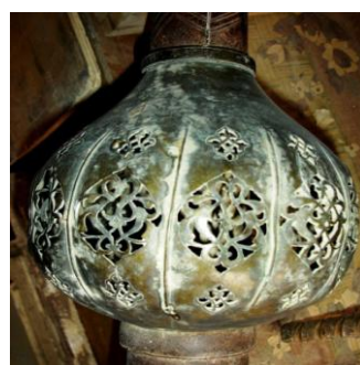
نگاره ۱۵ (صندوق مدور توغ، جوشقان)