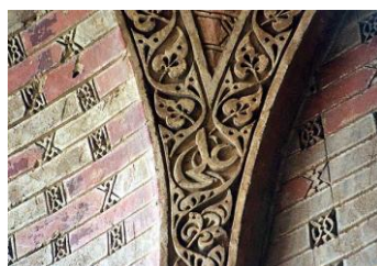
تصویر ۱. تکرار نام «علی» بر دیواره‌های بنای گنبد سلطانیه (سده هشتم هـ)