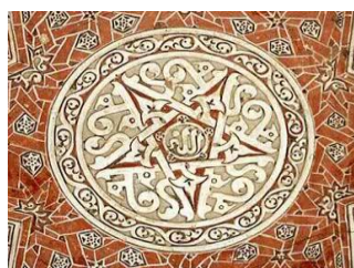
تصویر ۲. هم‌نشست نام‌های «الله»، «محمد» و «علی» بر سقف‌نگاره‌های گنبد سلطانیه

Barthes, Roland, Image-Music-Text , Stephen Heath (trans.), Fontana, London, 1977a.