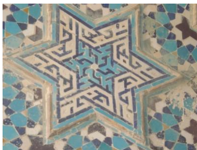
تصویر ۹. هم‌نشینی نام «محمد» و «علی» در کاشی کاری‌های مسجد جامع نطنز (سده نهم هـ)