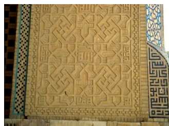
تصویر ۴. قوس ایوان مسجد جامع یزد (سده نهم هـ)