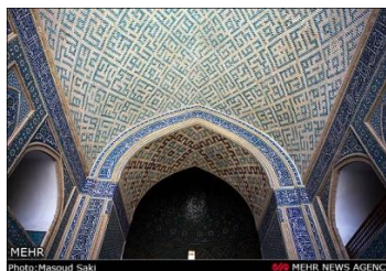
تصویر ۳. سقف ایوان مسجد جامع یزد (سده نهم هـ)