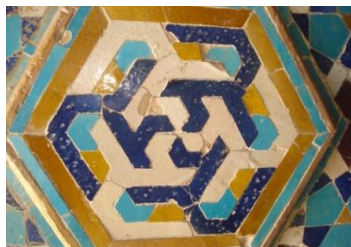
تصویر ۸. تکرار سه گانه نام «علی» بر دیوارهای کاشی کاری شده مسجد جامع ورزنه (سده نهم هـ)