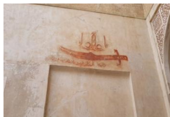
تصویر ۷. نمایی از نگاره‌های متاخر در مسجد جامع نطنز (سده هشتم هـ)