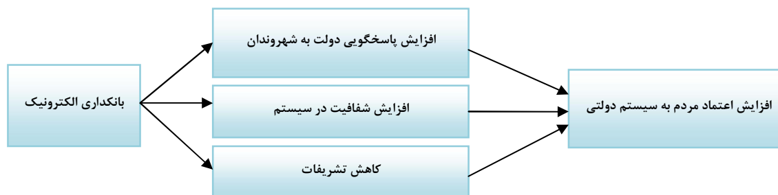
نمودار ۳: مدل مفهومی پژوهش

تحقیق حاضر نیز بر آثار کارکردی بانکداری الکترونیک به مثابه یکی از مهمترین زیر ساخت‌های تحقق دولت الکترونیک در ایران جهت سنجش فرضیات پژوهش تمرکز دارد.