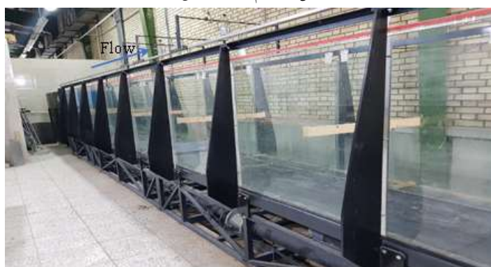
Fig 1. The laboratory channel