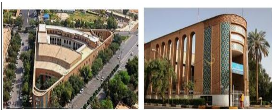
شکل ۲: ساختمان دانشکده سه گوش