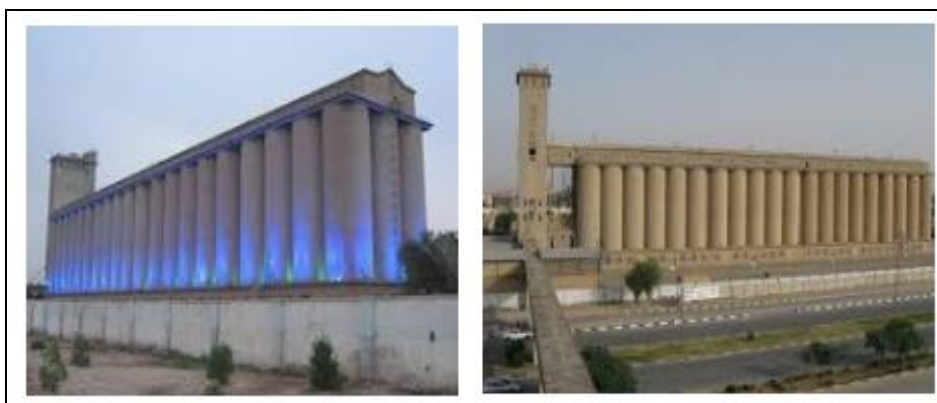
شکل ۳: ساختمان سیلو