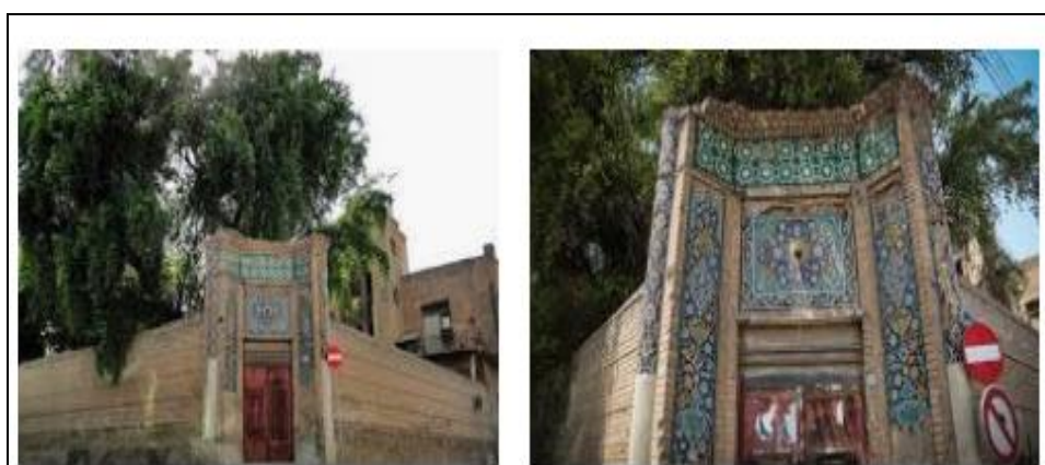
شکل ۴: ساختمان هتل فو