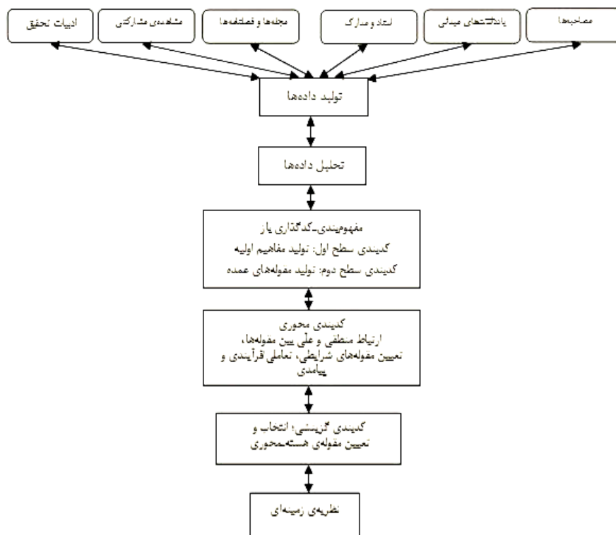
شکل ۱. مراحل انجام تحقیق بر اساس نظریه زمینه بنیان