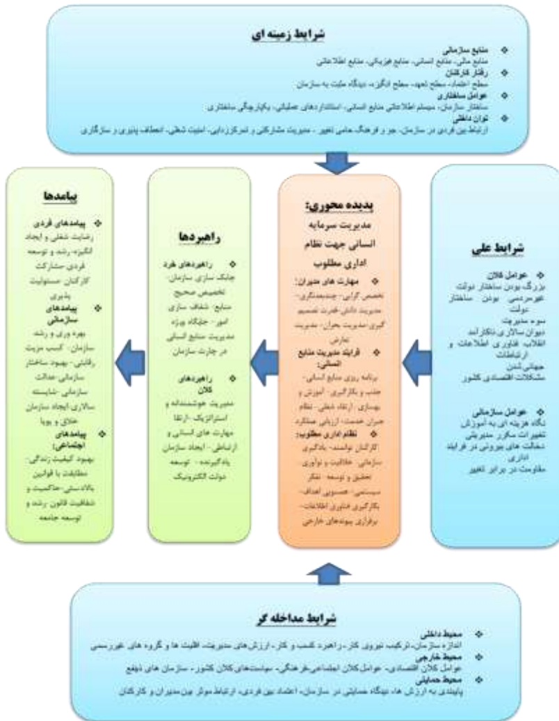
شکل ۱: الگوی پارادایمی مدیریت سرمایه انسانی در ارتقای نظام اداری

اداری (با ابعاد فرایند مدیریت منابع انسانی، مهارت‌های مدیران و نظام اداری مطلوب) تأثیر می‌گذارند و راهبردهای شناسایی شده شامل راهبردهای خرد و کلان و پیامدهای حاصل از مدیریت سرمایه انسانی در نظام اداری به صورت پیامدهای فردی، سازمانی و اجتماعی می‌باشد.