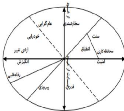
شکل ۱. ساختار ارزش‌های انگیزشی شوارتز

وجه تمایز مهم میان مولفه‌های فردی در ساختار ارزشها، در منافی است که در هر یک از این خصایص به دنبال حصول آن هستند. پنج گونه ارزشی قدرت، پیروزی، رفاه‌طلبی، انگیزش و خودفرمانی عمدتاً به دنبال تامین منافع فردی هستند. این گونه‌های ارزشی یک ناحیه پیوسته را مطابق شکل ۱ تشکیل می‌دهند. در حسابرسی به کارگیری این ارزش‌ها می‌تواند باعث شود که حسابرس منافع خود را به منافع سایرین ارجحیت دهد. از طرفی دیگر، اهداف انگیزشی خیرخواهی، سنت و انطباق ارزشهایی هستند که عمدتاً منافع گروهی را تأمین می‌کنند و در تضاد با منافع شخصی هستند. اهداف انگیزشی عام-گرایی و امنیت، که در مرز بین دو ناحیه قرار گرفته‌اند بطور همزمان حفظ منافع فردی و گروهی را در نظر می‌گیرند.