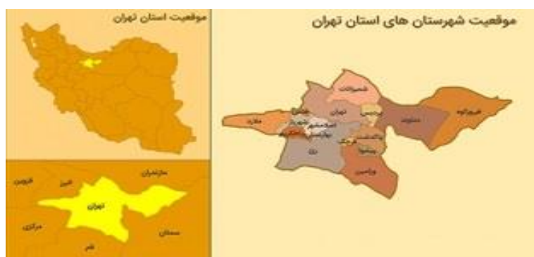
شکل ۱ - نقشه شهرستان‌های استان تهران

طبق آخرین سرشماری نفوس و مسکن مرکز آمار ایران در سال ۱۳۹۵ استان تهران حدود ۱۳۲۶۷۶۳۷ نفر جمعیت داشته است که حدود یک ششم جمعیت کشور را شامل می‌شود، درحالی‌که بر اساس این سرشماری در کل کشور نزدیک به سه چهارم جمعیت شهرنشین شده داند و درصد شهرنشینی در استان تهران به بالای ۹۰ درصد رسیده است که در واقع بعد از استان قم بیشترین نسبت شهرنشینی را دارد. استان تهران به لحاظ وسعت کمتر از یک درصد مساحت کشور را دارد این در حالی است که حدود ۲۰ برابر سهم مساحت آن از مساحت کشور جمعیت در آن متمرکز شده است. این تفاوت چشمگیر بین سهم از جمعیت و سهم از مساحت کشور باعث شده این استان با تراکمی برابر ۹۶۹ نفر در هر کیلومترمربع متراکم‌ترین استان در بین سایر استان‌های کشور باشد.