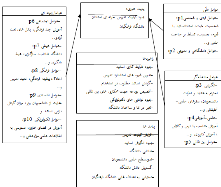
شکل ۲- الگوی تدریس با کیفیت استادان

ب: از دیدگاه متخصصان و اعضاء ستاد آموزشی دانشگاه فرهنگیان الگوی تدریس با کیفیت استادان دانشگاه فرهنگیان چگونه است؟ در مرحله چهارم عوامل استخراج شده از نظرات مدیران آموزشی و خبرگان به روش کد گذاری باز و محوری استخراج شده اند به ترتیب مرتب و موارد تکراری و مشابه حذف و موارد نهایی که شامل ۵۸ عامل بود استخراج شد. الگوی نهایی جهت تدریس حرفه ای با کیفیت در بین استادان دانشگاه فرهنگیان در شکل شماره ۲ قابل مشاهده است.