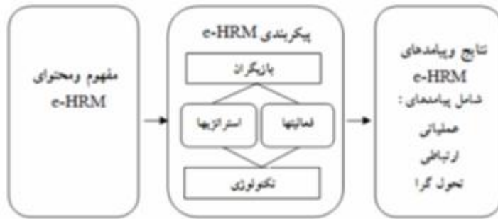
شکل ۲: اجزای مدیریت منابع انسانی الکترونیک (Strohmeier, 2007)

به بهره‌وری و اثربخشی خروجی‌های مدیریت منابع انسانی الکترونیک از قبیل کاهش هزینه‌ها یا کاهش فشار اجرایی مدیریت مربوط می‌شوند. نتایج ارتباطی بر پدیده ارتباط متقابل و شبکه‌بندی عاملان مختلف تأکید دارد و نتایج تحول‌گرا، تغییرات اساسی مربوط به چشم انداز و کارکرد کلی مدیریت منابع انسانی که مشخص کننده توانایی آن در کمک به عملکرد کلی سازمان است، را هدف قرار می‌دهد.