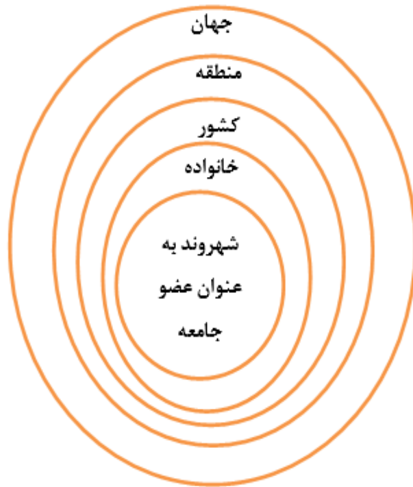
شکل ۱. رویکرد کل نگر آموزشی شهروندی

مانند تصادف جنگ، همه‌گیری ایدز، فقر جهانی و ... مشارکت فعال و کلیدی داشته باشد. همچنین آموزش شهروندی باید به افراد کمک کند تا شناخت شفاف و درستی از نقش خود در جامعه جهانی کسب نمایند و درک کنند، چگونه زندگی آن‌ها در جوامع فرهنگی‌شان، زندگی ملل دیگر را تحت تاثیر قرار می‌دهد و چگونه رویدادهای جهانی می‌توانند زندگی روزمره آن‌ها را تحت تاثیر قرار دهند. به‌طور کلی قلمرو برنامه‌های تربیت شهروندی به مرزهای ملی محدود نمی‌شود. بر این اساس، چرخه اجتماعی آموزش شهروندان از قلمرو فردی آغاز و سپس به خانواده، اجتماع محلی، ملی، منطقه ای و جهانی گسترش می‌یابد و در یک بافت تعاملی و متأثر از هم، با هم مرتبط هستند (Ghorchiyan & Eftekhazadeh, 2006) (شکل ۱).