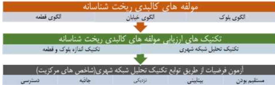
شکل ۱. راهکار تبیین مولفه‌های کالبدی - ریخت شناسانه در فضای شهری (ترسیم: نویسندگان، ۱۳۹۶)

ساختمان‌های اطراف معرف شاخص است. مستقیم بودن، شاخصی است برای سنجش نسبت مستقیم ترین راه به کوتاه ترین راه در محدوده (sevtsuk & mekonnen, ۲۰۱۲: ۱۳۲-۱۳۴). شکل ۱ ارتباط بین مولفه‌های الگو و توابع متد را نشان می‌دهد.