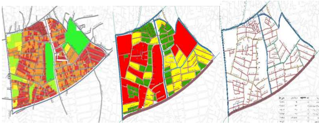
شکل ۲. عناصر کالبدی_ ریخت شناسانه (وضع موجود) در محدوده (الگوی خیابان، الگوی بلوک، الگوی قطعه). (ترسیم نویسندگان، ۱۳۹۶)