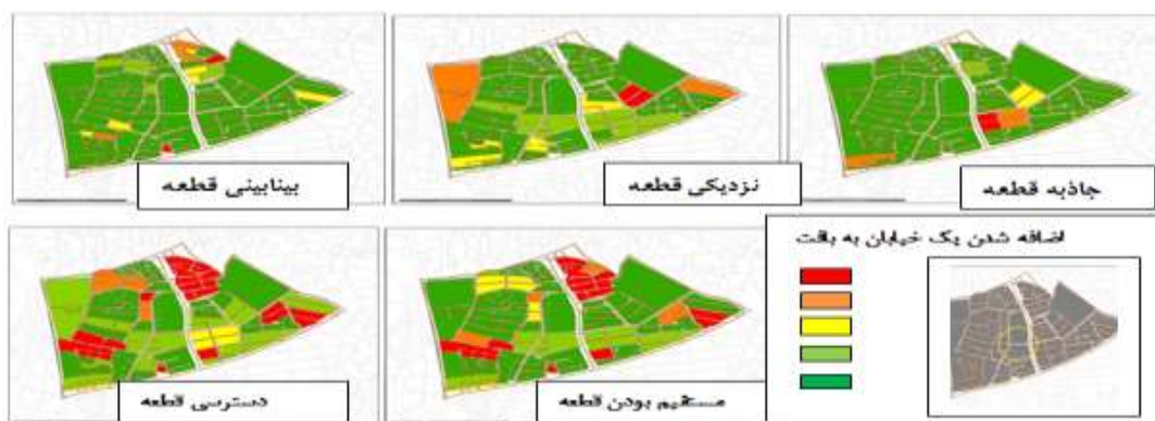
شکل ۲. محله قیصریه - تکنیک تحلیل شبکه شهری UNA برای بلوک‌ها (پس از ایجاد تغییر در بافت) (ترسیم: نویسندگان، ۱۳۹۶)

در این بخش، پس از تحلیل‌های اولیه و آزمون شاخص‌ها با متد تحلیل شبکه شهری، معضلات کالبدی ریخت شناسانه مشخص گردید. از این رو، نویسندگان برای آزمون افزایش بهره‌وری به اعمال تغییرات ریخت شناسانه در محله پرداخته، و این بار شاخص‌ها پس از تغییر برای بار دوم مورد تحلیل با متد تحلیل شبکه شهری قرار گرفته‌اند. در طرح پیشنهادی، درشت دانه