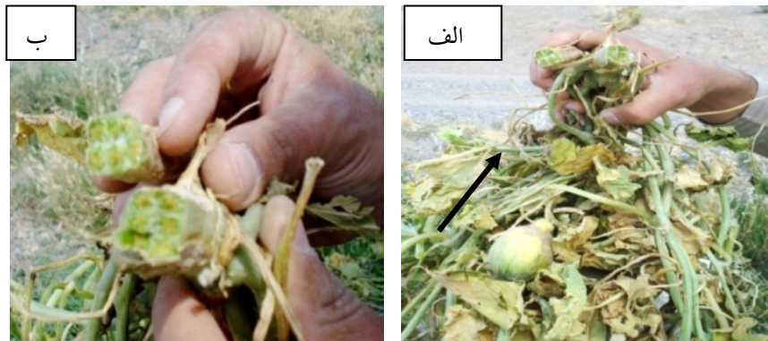
شکل ۲- علائم بیماری در گیاهان آلوده به Fusarium oxysporum f.sp. melonis جمع آوری شده از مزرعه (الف) زردی و پژمردگی. (ب) رنگ پریدگی آوند در ناحیه طوقه و ساقه.