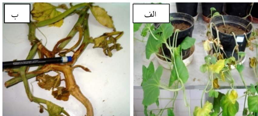
شکل ۳- الف) علائم پژمردگی و زردی در گیاهان مایه‌زنی شده با Fusarium solani پس از ۱۲ روز (سمت چپ) در مقایسه با شاهد (سمت راست). (ب) چوب پنبه‌ای شدن ناحیه طوقه و ترشح صمغ قرمز رنگ در اثر آلودگی F. solani