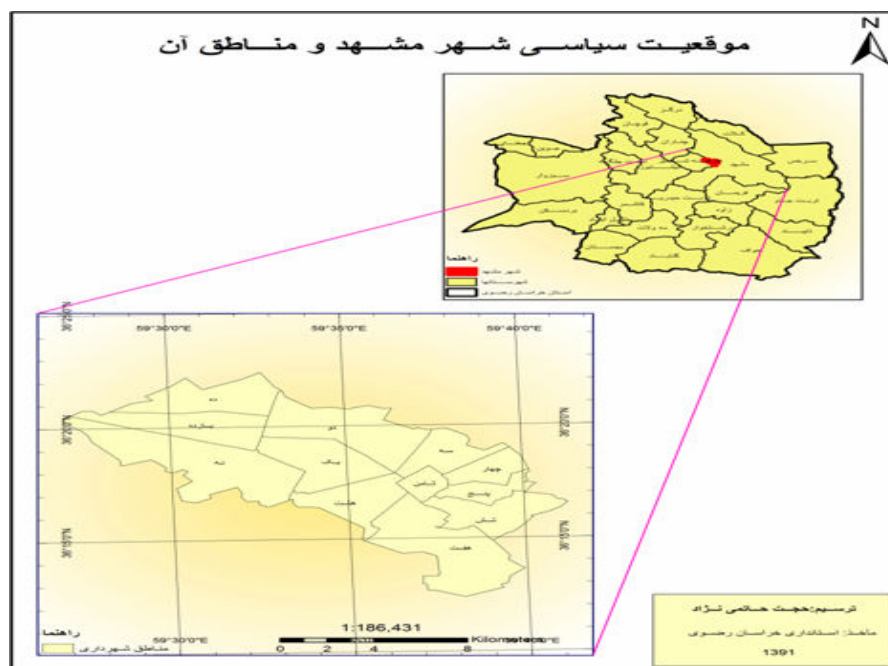
شکل ۱- نقشه موقعیت سیاسی - جغرافیایی شهر مشهد