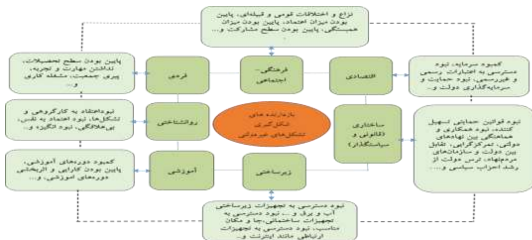
شکل ۱: مدل مفهومی پژوهش - (منبع: براساس واکاوی ادبیات و پیشینه موضوع، ۱۳۹۹)