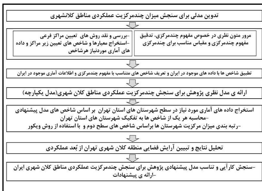
شکل ۱- فرآیند پژوهش

کمبود داده‌های آماری مبدا و مقصد سفر، عدم دسترسی به اطلاعات میزان استفاده از اینترنت بنگاه‌های اقتصادی و میزان درآمد خانوارها در شهرستان‌های استان تهران از مهم‌ترین محدودیت‌های پژوهش حاضر در تعیین شاخص‌های مؤثر برای سنجش میزان چندمرکزیت عملکردی است.