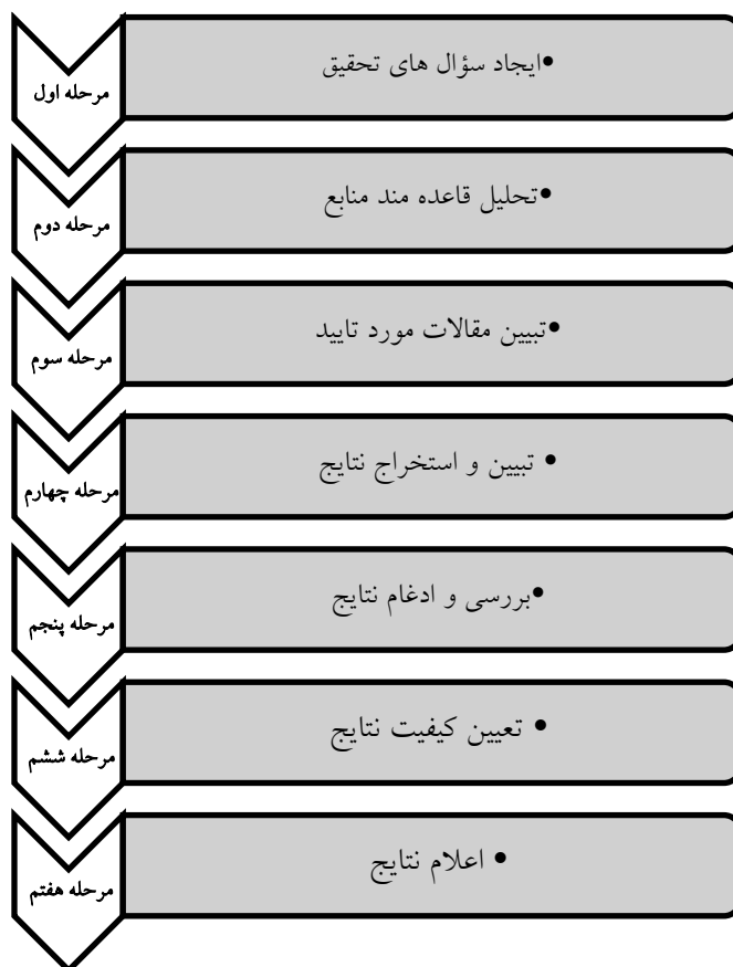
شکل 1 مراحل فراترکیب (اهرنفلدت و همکاران 4 ، 2013)

روش های متعددی برای انجام فراترکیب پیشنهاد شده است که الگوی هفت مرحله ای سندلوسکی و باروسو بیشترین کاربرد را دارد: