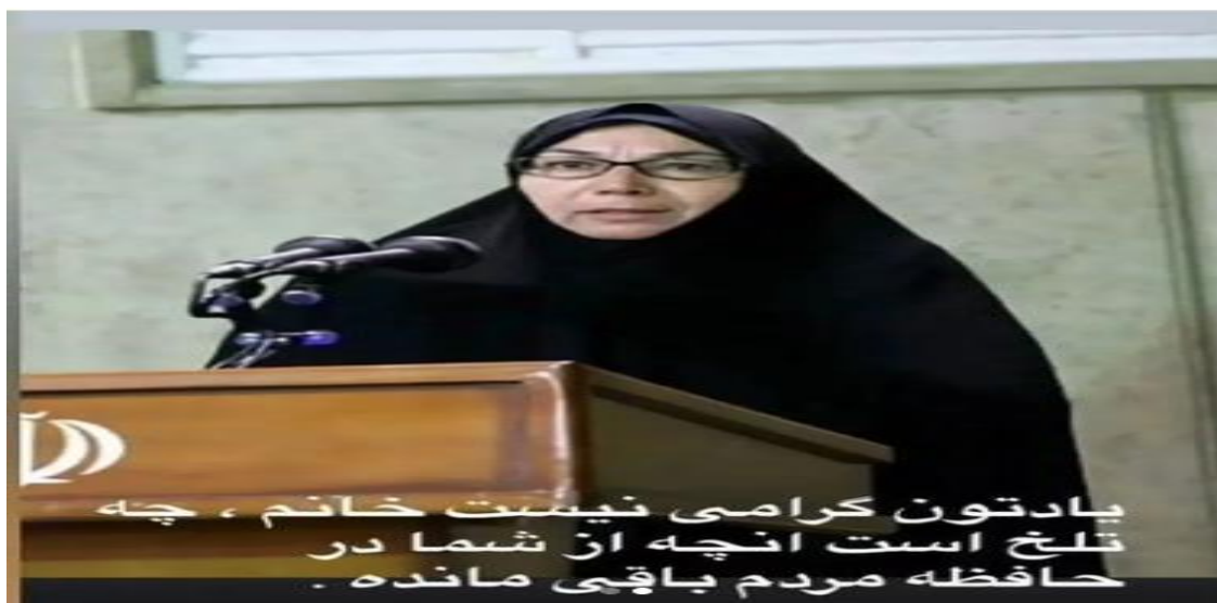
تصویر ۱ پست اینستاگرام بازیگر مرد ایرانی در واکنش به مرگ یک سلبریتی زن دیگر

در تصویر فوق، سلبریتی تلاش کرده است تا با به نمایش گذاشتن آنچه که در تصویر قرار دارد و نکوهش ضمنی آن از طریق نشانگان تصویری موجود در آن به تأیید ارزش‌هایی بپردازد که در این عکس وجود ندارد. همانگونه که در این تصویر مشخص است هیچ نشانه یا عنصری از «تصویری ما» در این پست اینستاگرامی قابل مشاهده نیست، اما چارچوب تصویر، عکس، چیدمان سوژه در کنار پس زمینه و پیش زمینه و گفتمان کلامی که در این تصویر به کار برده شده است به مخاطب این پیام را منتقل می‌کند که در حال تماشای یک پیام در مورد «دیگری» است. دقت در توضیح تصویری که از سوی منتشر کننده تصویر بر روی عکس درج شده است نمایش این تمایز موجود میان «دیگری» و «ما» را برای ما و مخاطب هویدا می‌کند.