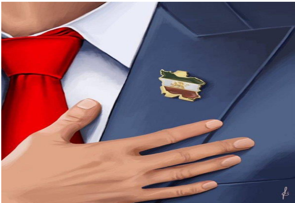
تصویر ۴ عکس نمادین منتشر شده در صفحه سلبریتی مرد در مورد نقش‌آفرینی رضا پهلوی

تصویری از یک شخص نمودند که دست به سینه است و کارزار اینترنتی "من وکالت می‌دهم" را در حمایت از رضا پهلوی به راه انداختند.