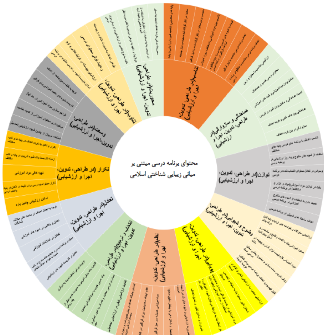
شکل ۳. برنامه درسی مبتنی بر آیات و روایات در مدل خورشیدی

در نهایت، بر اساس خروجی PLS می‌توان برنامه درسی مبتنی بر آیات و روایات را در مدل خورشیدی در شکل فوق مشاهده نمود.