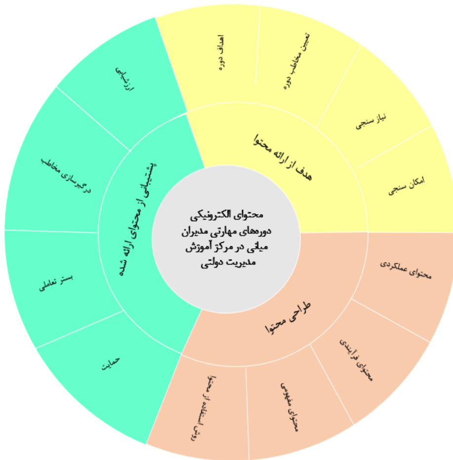
شکل ۲- مدل نهایی پژوهش