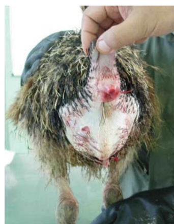
شکل شماره ۴- وضعیت نهایی جوجه شماره دو پس از انجام بخیه سرکیسه ای.

درمان سیستمیک با داکسی سیکلین (داروپخش - ایران) ۲ mg/kg خوراکی و فلونکسین مگلو مین (ابوریحان - ایران)