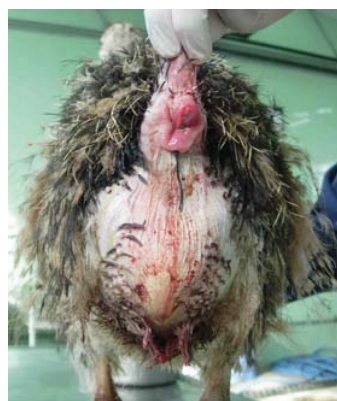
شکل شماره ۳- وضعیت نهایی جوجه شماره یک پس از انجام بخیه سرکیسه ای.

اسکراپ ۲ درصد ضد عفونی و سپس توسط سالیین نرمال آبخشی شد. محل زخم بر روی کلوک جوجه شماره ۲ با استفاده از نخ پلی گلاکتین ۹۱۰ (طب کیهان- ایران) شماره ۳ صفر و با الگوی ساده سرتاسری دوخته شد. سپس با مرطوب کردن ناحیه توسط سالیین نرمال، کلوک ها را جانداخته و با نخ ابریشم شماره صفر و با الگوی سرکیسه ای به فاصله یک سانتیمتری از لبه مقعد، دوخته شد. (اشکال شماره ۳ و ۴)