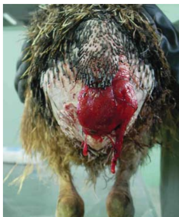
شکل شماره ۲ - زخم تمام ضخامت در سمت راست قسمت شکمی بافت بیرون زده کلواک در جوجه شماره دو.

جوجه شماره ۲: کلواک به قطر تقریبی ۵ سانتیمتر، دارای تورم نسبی، به رنگ قرمز روشن، که احتمالاً به دلیل گیر کردن به اجسام خارجی دارای زخمی تازه، فاقد خونریزی و هلالی شکل به طول ۴ سانتیمتر و به عمق ۰/۵ سانتیمتر بر روی سطح شکمی بافت مخاطی بود. (شکل شماره ۲)