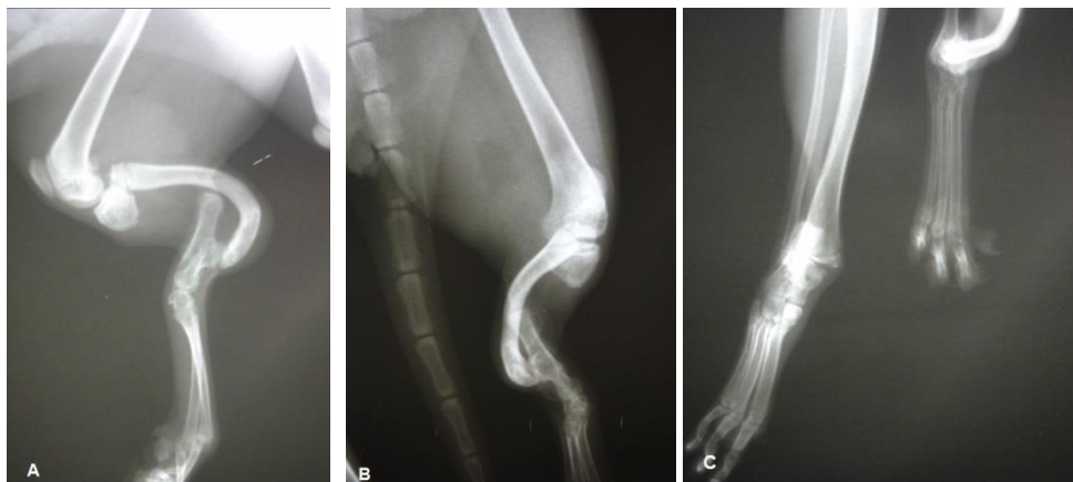
تصویر ۲: A نمای جانبی اندام حرکتی خلف چپ، B نمای قدامی خلفی از ناحیه ساق، C نمای پشت پای - کف پای از ناحیه