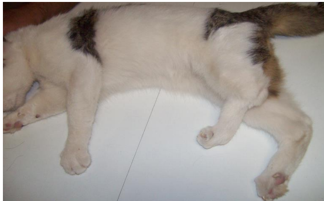
تصویر ۱: بد شکلی اندام حرکتی خلفی چپ، چرخش پا از ناحیه مچ به پایین