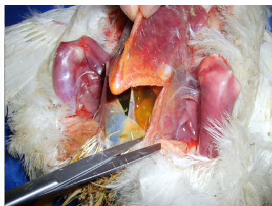
تصویر شماره ۱: نمایی از محوطه بطنی جوجه تلف شده در گروه درمان ۳ که در آن آسیت ناشی از نارسایی قلبی مشاهده می‌شود.