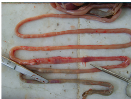
تصویر شماره ۲: جراحات بوجود آمده توسط ایمریها که در سطح سروزی روده در گروه کنترل منفی مشاهده می‌شود.

با افزایش دوز در کلیه نیز علائم مسمومیت قابل مشاهده می‌باشد. کلیه‌ها پر خون و در برخی مناطق دارای خونریزی شدید می‌باشد با افزایش دوز، خونریزی‌ها گسترش یافته و حتی در زیر کپسول نیز قابل رویت است. سلول‌های جدار لوله‌های ادراری دچار تورم حاد سلولی (ACS) شده و رأس آنها گنبدی شکل و لومن لوله‌ها بسته شده‌اند. تورم